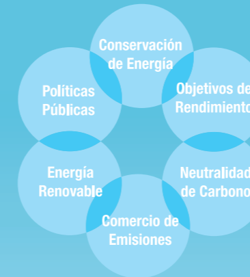
Enfoque de Baxter frente al Cambio Climático